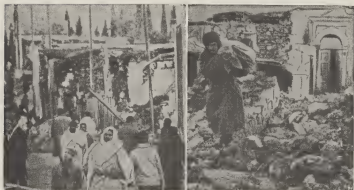
E dos grabados aki riba ta representa dos veta, despues cu un temblor a sacudi e ciudad Barca na Libia. Na man robes nos ta mira e restonan di e ciudad Barca y na man drechi nos ta mira un di e habitantenan cu a sobrevivi e desastre y ta camina cu algun di su propiedadnan, cu a resta.